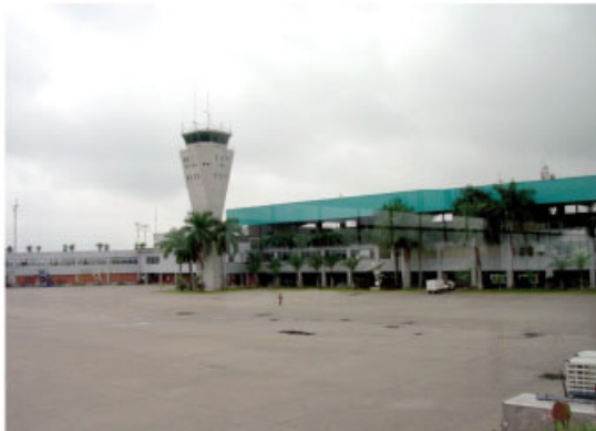
AEROCALI – NUEVO AEROPUERTO ALFONSO BONILLA ARAGÓN