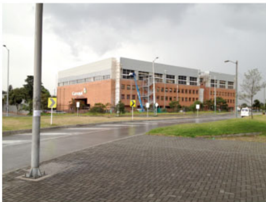
SEDE CARVAJAL BOGOTÁ