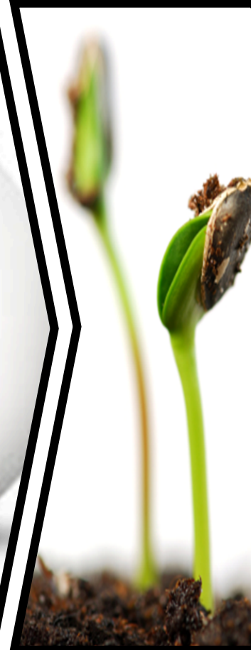
Puesta en Marcha