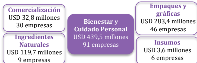
Gráfico 5. Ventas de la industria de apoyo de la cadena productiva de Bienestar y Cuidado Personal - 2014 (USD millones)