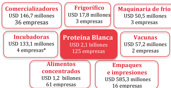
Gráfico 1. Ventas de la Industria de Apoyo del Cluster de Proteína Blanca - 2014 (USD millones)

*Comprende la proporción de la actividad de incubación de Pollos el Bucanero y Avidesa de Occidente