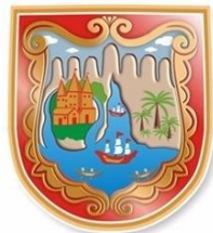
ALCALDÍA DE SANTIAGO DE CALI