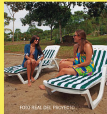
FOTO REAL DEL PROYECTO